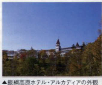
▲飯綱高原ホテル・アルカディアの外観